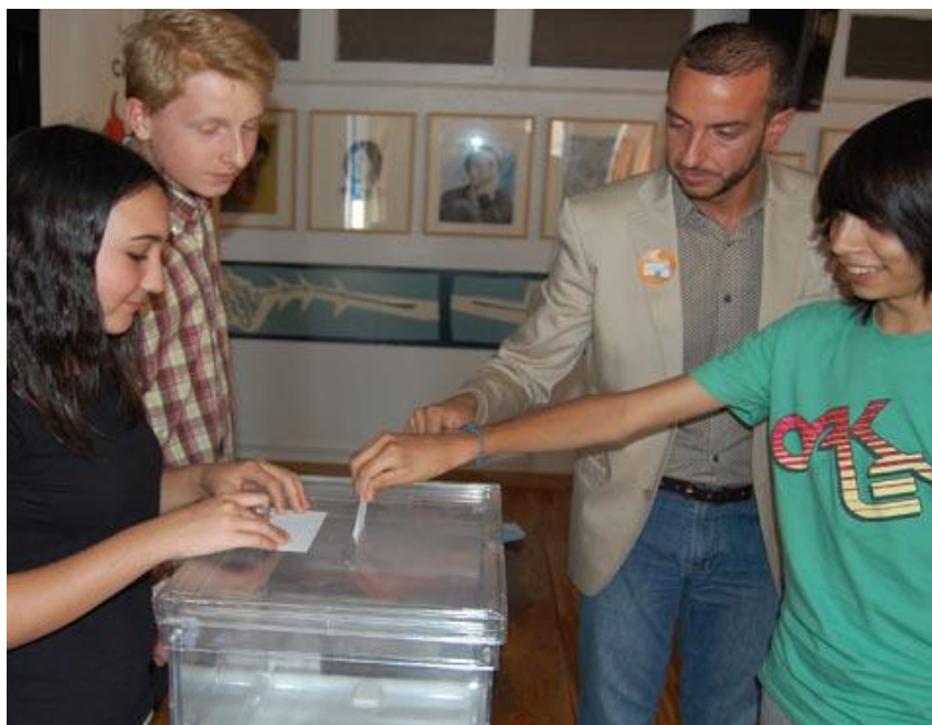
En la foto: durante una de las charlas en IES.

En torno al pasado 22 de mayo, el Colegio tuvo una amplia actividad con la puesta en marcha de su campaña de promoción de la participación electoral. De nuevo, en octubre y noviembre de 2011 el Colegio animará a la ciudadanía a participar y para ello se han programado una serie de actividades como conferencias, charlas en IES y jornadas de análisis.