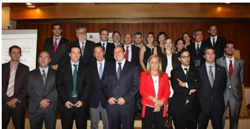
Foto de familia: premiados, homenajeados y jurado la noche de la Gala.

Durante una Gala celebrada el 19 de octubre de 2010 se entregaron los Premios Profesionales con los que se reconoció el trabajo de los profesionales de la Ciencia Política y la Sociología en los ámbitos de la política y la administración pública, de la universidad, de la empresa y del tercer sector. También fueron homenajeados los promotores del Colegio en la Región. Páginas 6-8.