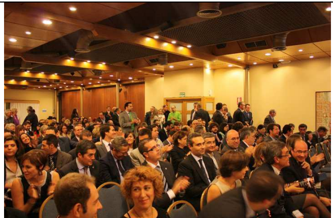
250 personas abarrotaron el salón