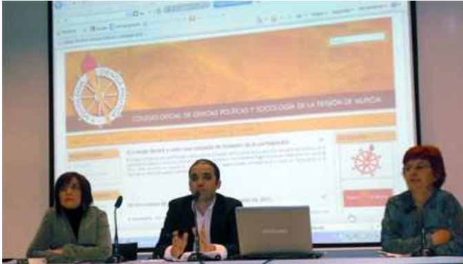
Foto: Amparo Albentosa (izq), Eugenio Martínez y Marina García (dcha.).

El Salón de Actos del Museo Arqueológico de Murcia fue testigo del III Encuentro de Profesionales.